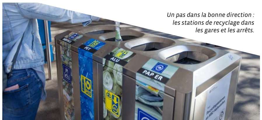
Un pas dans la bonne direction : les stations de recyclage dans les gares et les arrêts.

Pour que le système de recyclage local puisse continuer de se développer, Swiss Recycling a élaboré, conjointement avec des représentants de l'EPF et Carbotech, un